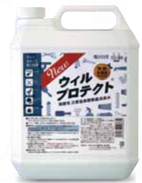
容量:4L (200mlビーカー付き)